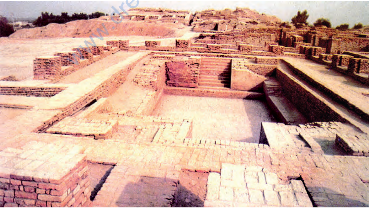
मोहनजोदड़ो का महान स्नानागार

सिंधु घाटी सभ्यता और वर्तमान भारत के बीच समय के ऐसे कई दौर गुज़रे हैं जिनके बारे में हम बहुत कम जानते हैं। वैसे भी इस बीच असंख्य परिवर्तन हुए हैं। लेकिन भीतर ही भीतर निरंतरता की ऐसी शृंखला चली आ रही है जो आधुनिक भारत को छः-सात हज़ार पुराने उस बीते हुए युग से जोड़ती है जब संभवतः सिंधु घाटी सभ्यता की शुरुआत हुई थी। यह देखकर अचरज होता है कि मोहनजोदड़ो और हड़प्पा में कितना कुछ ऐसा है जो हमें