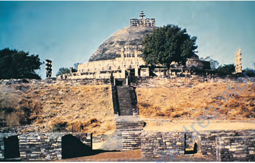
अशोक के समय में निर्मित साँची का स्तूप

इस अद्भुत शासक ने, जिसे आज भी भारत और एशिया के बहुत से दूसरे भागों में प्यार से याद किया जाता है, अपने आपको बुद्ध की शिक्षा के प्रचार में, नेकी और सद्भाव के काम में तथा प्रजा के हित के लिए सार्वजनिक कार्यों के प्रति समर्पित कर दिया। उसने ऐलान कर दिया था कि वह इनके लिए हमेशा तैयार है। हर स्थान पर और हर समय, सरकारी कर्मचारी जनता के कार्यों के बारे में उसे बराबर सूचना देते रहें, चाहे जिस समय और जहाँ भी हो वह लोक-हित के लिए अवश्य काम करेगा।