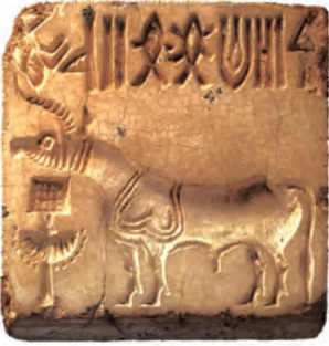
एक हड़प्पाई मुहर

भारत के अतीत की सबसे पहली तस्वीर उस सिंधु घाटी सभ्यता में मिलती है, जिसके अवशेष सिंध में मोहनजोदड़ो और पश्चिमी पंजाब में हड़प्पा में मिले हैं। इन खुदाइयों ने प्राचीन इतिहास की समझ में क्रांति ला दी है।