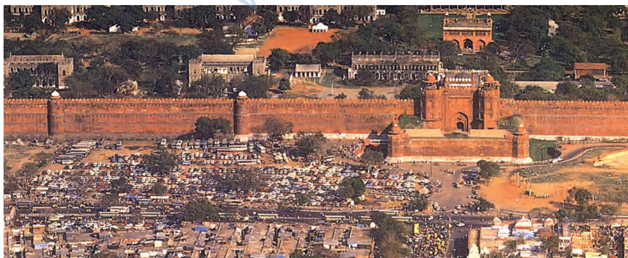
लाल किला (दिल्ली)

यदि अकबर ने इस तरफ़ ध्यान दिया होता और पता लगाया होता कि संसार के दूसरे हिस्सों में क्या हो रहा है तो उसने सामाजिक परिवर्तन की