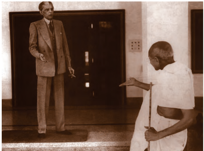
जिन्ना और गांधी

ज़ाहिर है कि धार्मिक दीवारें स्थायी नहीं होतीं और जो व्यक्ति अपना धर्म बदलता है उसकी जातीय पृष्ठभूमि या उसकी जातीय और भाषिक विरासत नष्ट नहीं हो जाती। परंतु राजनीतिक मामलों में, धर्म का स्थान सांप्रदायिकता ने ले लिया है। यह एक संकीर्ण समुदाय