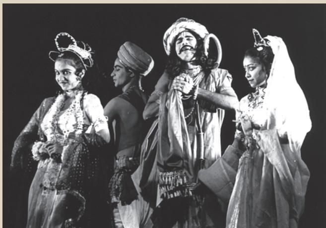
शास्त्रीय शैली में खेले गए नाटक का एक दृश्य

रंगमंच प्रतिरोध का सबसे सशक्त माध्यम है। क्या आप लेखक के इस विचार से सहमत हैं? पक्ष और विपक्ष का समूह बनाकर इस विषय पर चर्चा करें।