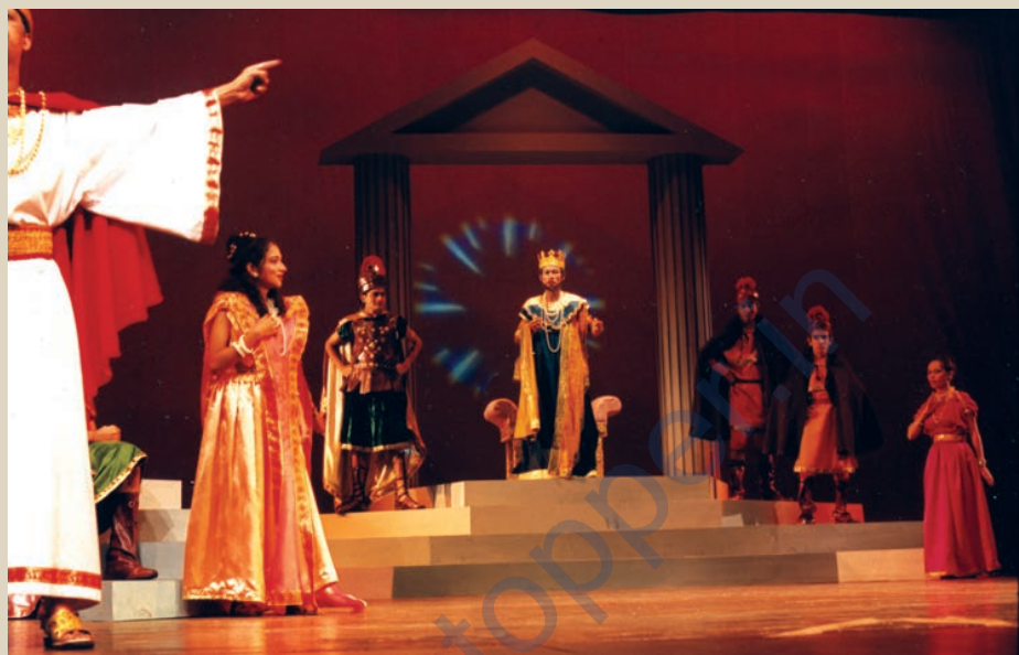
पारसी थिएटर शैली में खेले गए नाटक का दृश्य

कह दिया जाता है। कविता इससे आगे है। इसके शब्द, बिंब और प्रतीक में बदलने की क्षमता भी रखते हैं। इसी कारण सहित्य की सभी विधाओं में कविता ही नाटक के सबसे ज़्यादा निकट जान पड़ती है। वैसे कहानी या उपन्यास में भी वर्णन घटित होता है लेकिन अंतर यह है कि नाटक में वह कहानी सचमुच हमारी आँखों के सामने घटित होती है। इसी आधार पर कहा जाता है कि एक कवि सफल नाटककार भी हो सकता है। ऊपर के तथ्यों को ध्यान में रखते हुए निष्कर्ष यह निकला कि नाटककार के लिए ज़रूरी है कि वह अधिक से अधिक संक्षिप्त और सांकेतिक भाषा का प्रयोग करे जो अपने आप में वर्णित न होकर क्रियात्मक अधिक हो, उन शब्दों में दृश्य बनाने की क्षमता भरपूर हो और वह अपने शाब्दिक अर्थ से ज़्यादा व्यंजना की ओर ले जाए। यह कहा भी गया है कि अच्छा नाटक वही होता है जो लिखे अथवा बोले गए शब्दों से भी ज़्यादा वह ध्वनित करे, जो लिखा या बोला नहीं जा रहा। नाटक का मात्र एक मौन, अंधकार या ध्वनि-प्रभाव कहानी या उपन्यास के बीस-पच्चीस पृष्ठों की बराबरी कर सकता है।