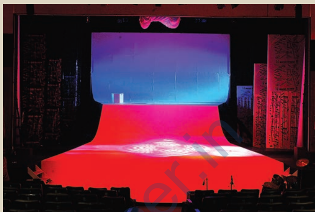
'मिडनाइट चिल्ड्रेन' की रंगमंच सज्जा, इसमें फिल्म और रंगमंच शैलियों की संयुक्त प्रस्तुति दर्शाई गई है

अब दूसरा महत्वपूर्ण अंग है— शब्द ! वैसे यह साहित्य की सभी विधाओं के लिए आवश्यक होता है। पर, साहित्य की ही दो विधाओं, कविता और नाटक के लिए शब्द का विशेष महत्व है। नाटक की दुनिया में शब्द अपनी एक नयी, निजी और अलग अस्मिता ग्रहण करता है। हमारे नाट्यशास्त्र में भी वाचिक अर्थात् बोले जाने वाले शब्द को नाटक का शरीर कहा गया है। कहानी तथा उपन्यास शब्दों के माध्यम से किसी स्थिति, वातावरण या कथानक का वर्णन करते हैं या अधिक से अधिक उसका चित्रण कर पाते हैं। यही कारण है कि इसे वर्णित या फिर नैरेटिव विधा